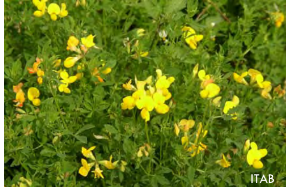
Lotier cornicule : fourrage appétent

La réussite du couvert permet de maintenir la matière organique du sol. Il