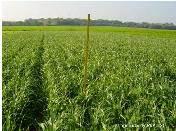
J. Labreuche (ARVALIS)

Le schéma page suivante récapitule les grandes questions à se poser. Il présente les différentes étapes du raisonnement proposées dans ce cahier afin de choisir l'espèce (ou les espèces) mais aussi de définir les conditions d'implantation et de destruction du couvert végétal.