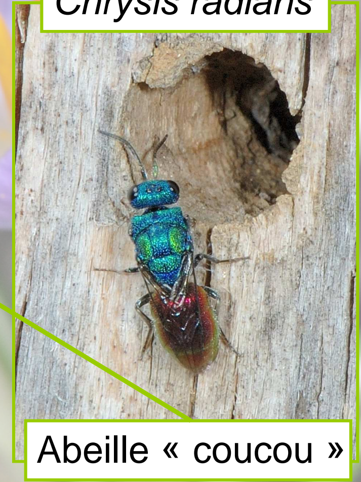
Abeille « coucou »