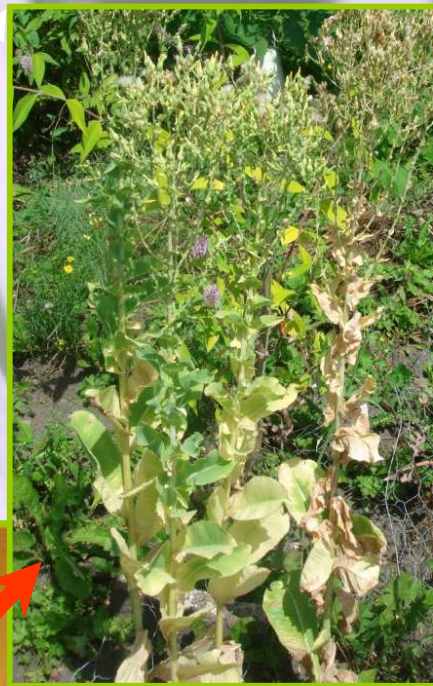
Graines de salade