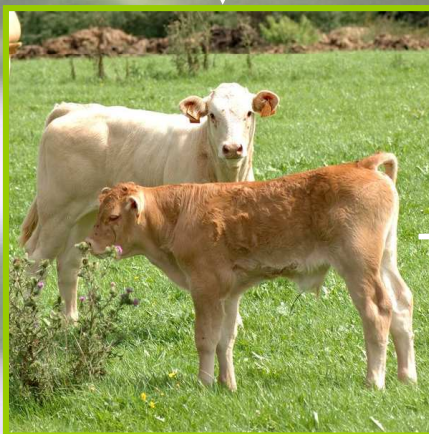
Nourris de concentrés de luzerne